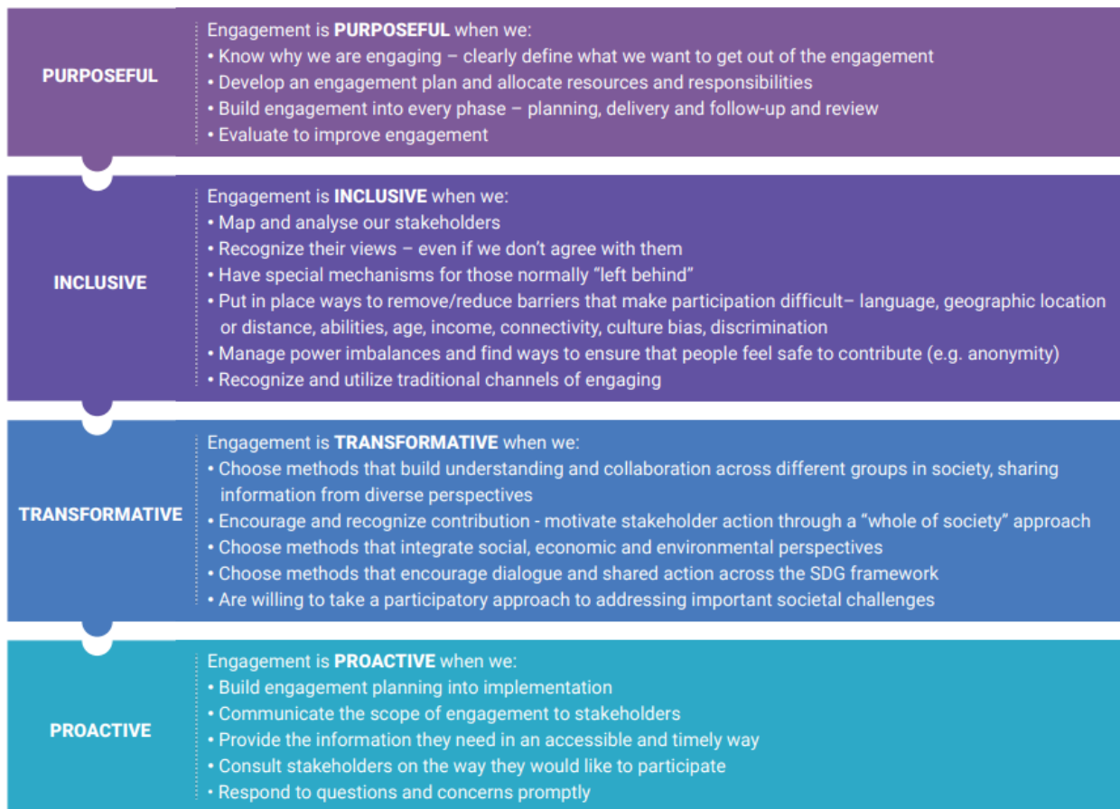
Figura 18: Esquema de compromís amb la qualitat