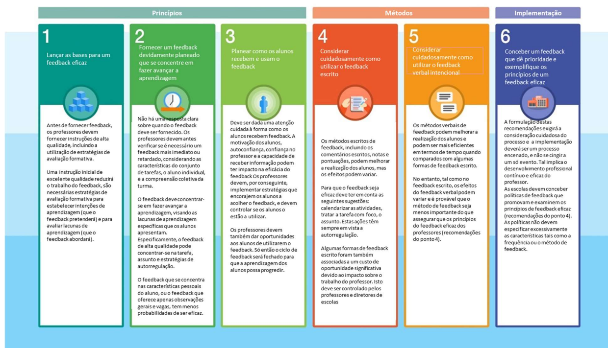
Figura 17: Feedback do professor para promover a aprendizagem do aluno [link] (Fonte: Guidance report. 2022. Joe Collin and Alex Quigley, Education Endowment Foundation.)