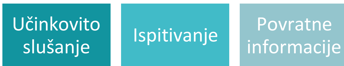
Slika 4 – Tri glavne karakteristike razgovora o profesionalnom učenju.

Smislen mentorski odnos se oslanja na uspostavljanje i održavanje plodonosnog, uspješnog i učinkovitog razgovora o profesionalnom učenju koji ima sljedeće glavne karakteristike: