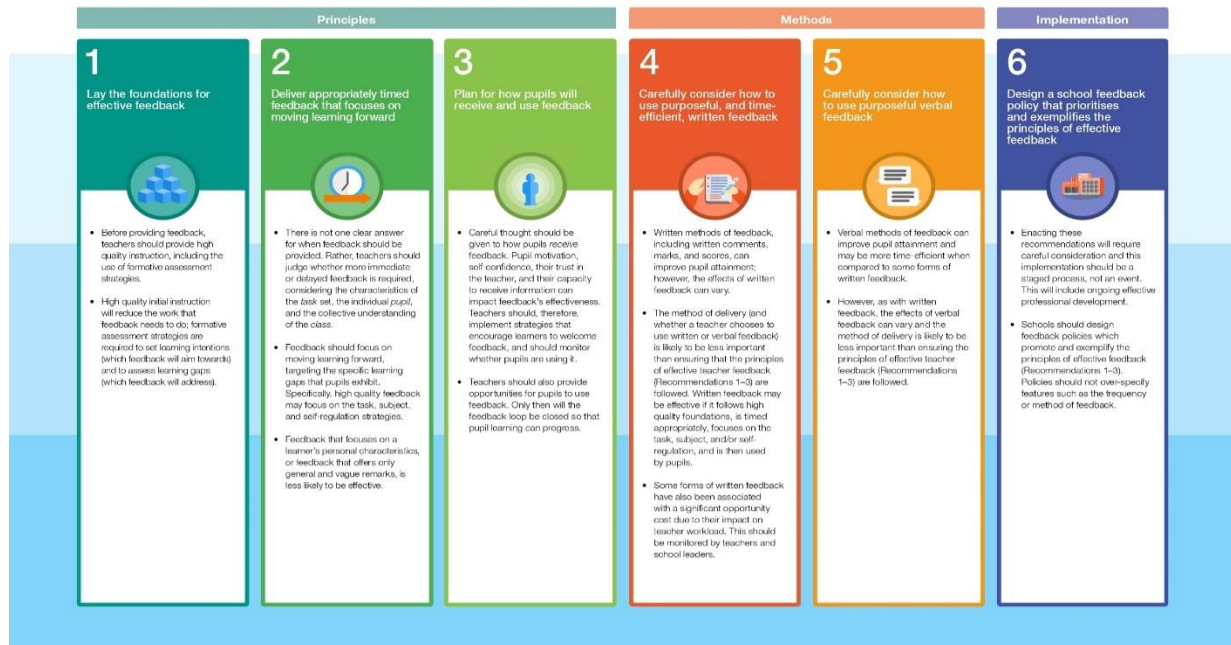
Figura 17: Teacher Feedback to improve pupil learning [enllaç] (font: Guidance report. 2022. Joe Collin and Alex Quigley, Education Endowment Foundation.)