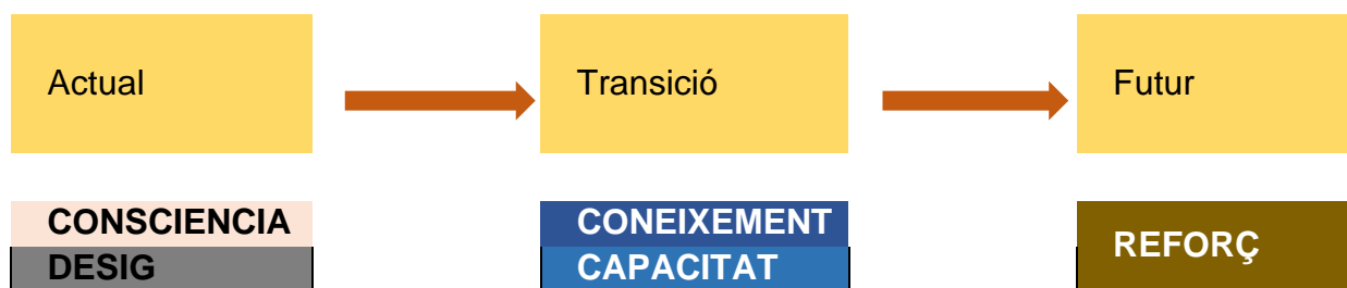
Figura 5: Metodologia ADKAR

La metodologia ADKAR suggerida aquí està orientada a resultats. Està pensat per ser utilitzat per facilitar el canvi desitjat (transició) fixant fites clares a assolir al llarg del procés, permetent una transició planificada, per millorar l'equilibri tan desitjat (el futur).